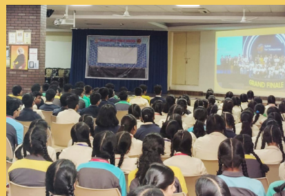
Orientation Session by Samsung Solve for Tomorrow 2025