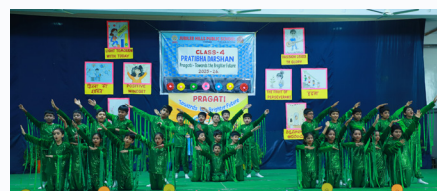
Yojana Ki Shakti