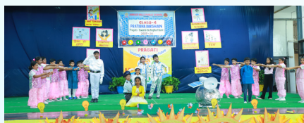
Passion Leads to Glory