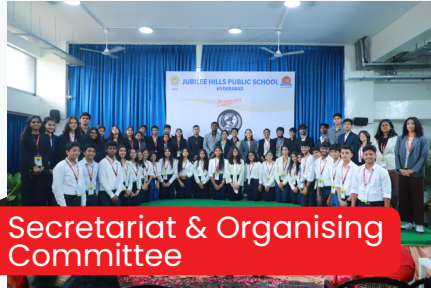
Secretariat & Organising Committee