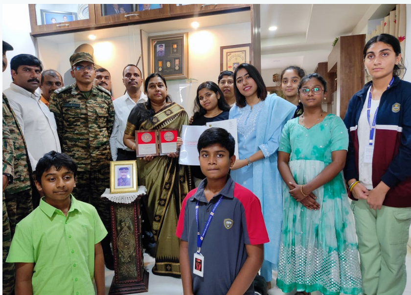
Paying Tribute to the Family of Martyrs