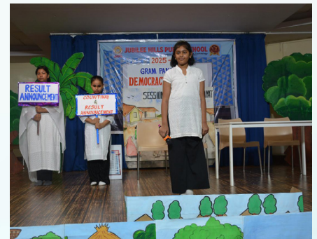
Counting of Votes