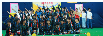
The Fruit of Perseverance