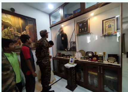
Visit to House of Martyrs