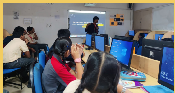
Exclusive Workshop By IIT Hyderabad & Make Intern