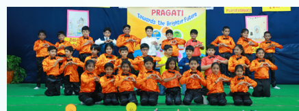
Light Tomorrow with Today