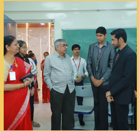
Committee Sessions Visited by Dignitaries