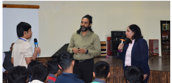
Enriching Session on Cyber Security by Hyderabad City Security Council (HCSC)