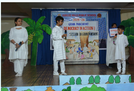
Introduction To Panchayati Raj