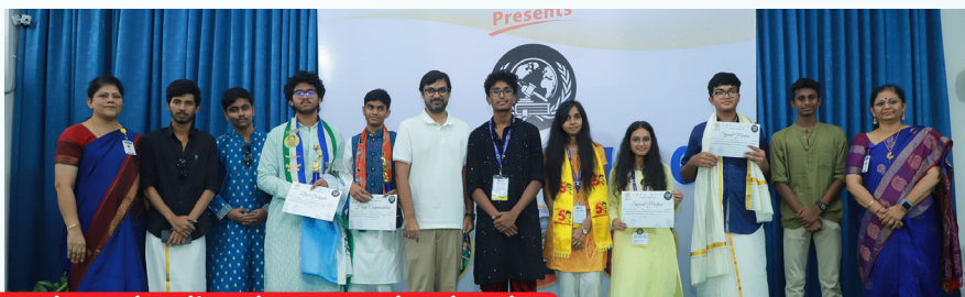
Prize Distribution by Dignitaries